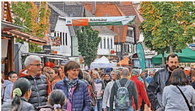
Reges Treiben beim verkaufsoffenen Sonntag in Herbolzheim