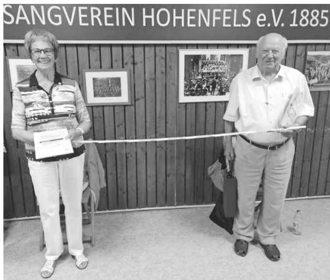
Die Geehrten unter Einhaltung der Coronavorschriften