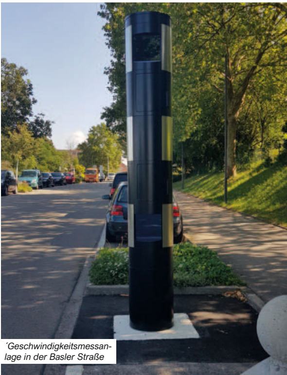
Geschwindigkeitsmessenanlage in der Basler Straße

Mehr Sicherheit und weniger Lärm – dafür hat sich der Bad Krozinger Gemeinderat mit seinem Beschluss für das Aufstellen von stationären Blitzern in der Thermenallee und der Basler Straße entschieden. Beide Geschwindigkeitsmessenanlagen wurden Anfang August in Betrieb genommen.