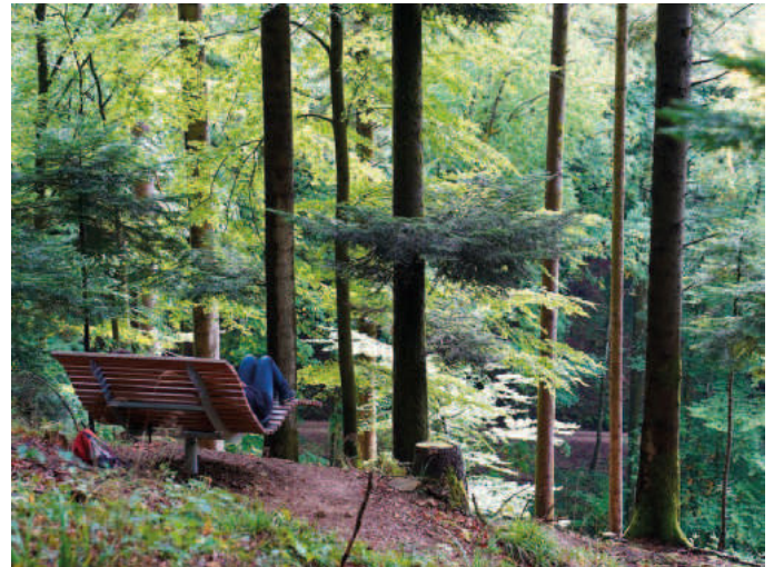
Shinrin Yoku - Waldbaden

Tickets: Tourist-Info, Tel. 07633 4008-163