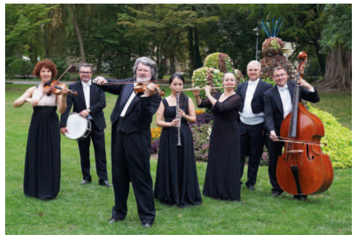
Johann-Strauß-Ensemble