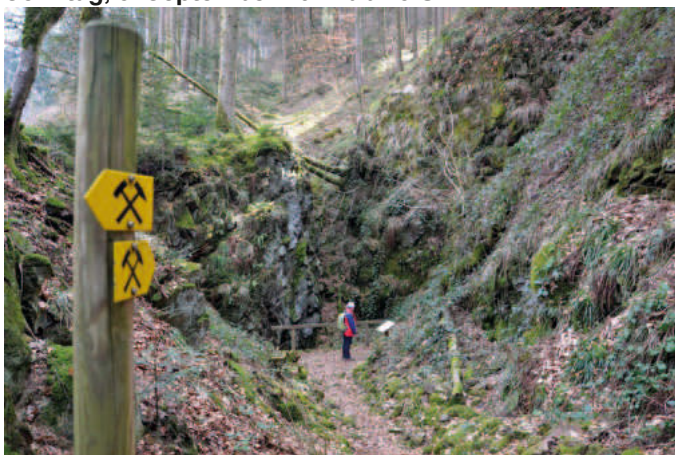
Blick in den Verhau mit Radstube

Für große und kleine Entdecker werden am Sonntag, den 5. September 2021 ab 15 Uhr stündlich oder nach Bedarf Führungen durch das mittelalterliche Bergbaurevier am Birkenberg bei Bollschweil-St. Ulrich angeboten. Mit Casimir Bumiller, Heinz Krieg und Christel Bucker kann man auf dem 1,6 km langen Lehrpfad