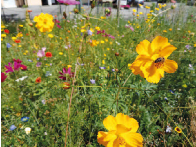
So blüht es derzeit auf der Blühfläche Graserweg/Schlatter Straße

Die Stadt Bad Krozingen ist eine von 61 Kommunen in Baden-Württemberg, die an dem Landesumweltprojekt „Natur nah dran“ teilgenommen haben, bei dem sich Städte und Gemeinden für die biologische Vielfalt im Siedlungsraum einsetzen. Nach Abschluss der ersten Projektphase gab es dafür für die Stadt Bad Krozingen eine Urkunde von Landesumweltministerin Thekla Walker und dem NABU Baden-Württemberg.