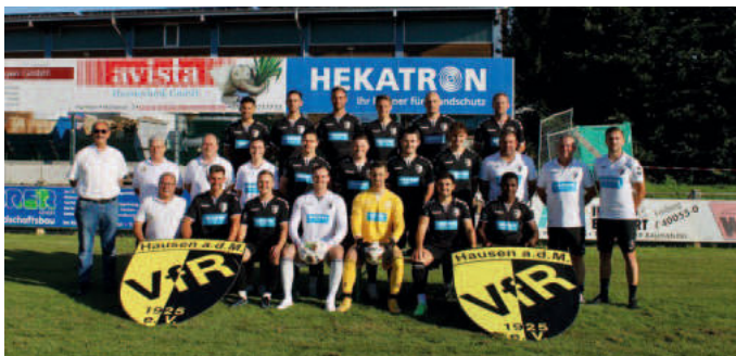
1. Mannschaft VfR Hausen 1925 e.V.

Die 1. Mannschaft und der VfR-Vorstand freuen sich Sie bald einmal wieder zu spannenden Spielen in der Möhlinarena begrüßen zu dürfen. Alle Spiele und weitere Beiträge auf www.vfrhausen.de . Bleiben Sie gesund!