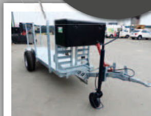
Anhänger- & Fahrzeugbau