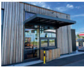
Überdachungen & Carports