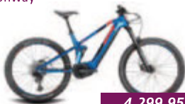
Xyron S 2.7 Conway