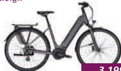
Kent Edition Raleigh