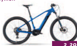
HardRay E 6.0 Raymon