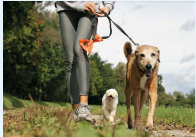
Alle Hunde (auch der kleine Pudelmix) gehören zumindest während der Brut- und Setzzeit in der freien Natur an die Leine - darum bittet der Landesjagdverband in einer aktuellen Pressemitteilung.

Der Landesjagdverband nennt deshalb drei gute Gründe, weshalb HundehalterInnen ihren Liebling in den kommenden Wochen an der Leine lassen sollten.