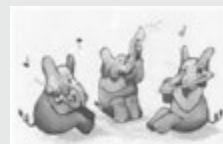
Elefanten aus „Piccolini & Brassini“