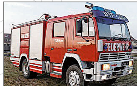
Das Feuerwehrauto, das erworben werden soll.

Aufgrund dieser persönlichen Begegnung bitten wir die Herbolzheimer Bevölkerung, die Stadt Vyshhorod aktiv zu unterstützen. Geplant ist der Kauf eines gebrauchten Feuerwehrautos im Wert von 17.000 Euro. Dieses soll gemeinsam mit der Stadt Eichenau (einer deutschen Partnerstadt der Stadt Vyshhorod) und mithilfe eines Hilfsgütertransports in die Ukraine gebracht werden soll und vor Ort dringend benötigt wird.