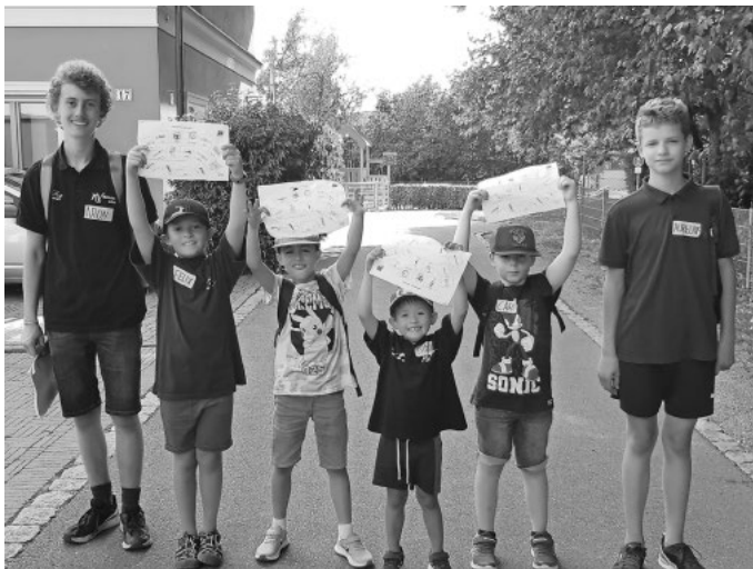
Musikalische Schnitzeljagd beim Sommerferienprogramm