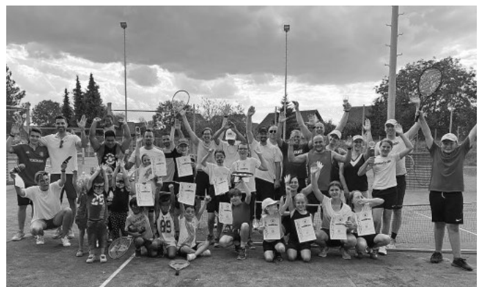
Begeisterte Teilnehmer am Generationenturnier des TC Rielasingen