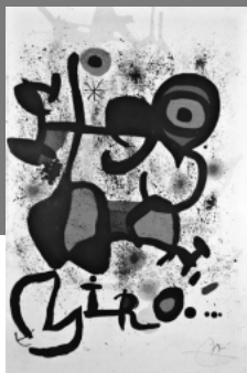
Joan Miró, Ausstellungsplakat Zürich, 1972