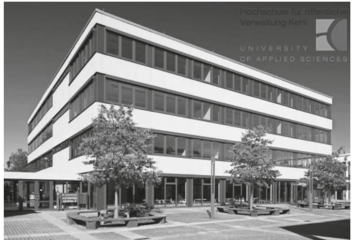
Studieninformationstag am 21. November 2018 Hochschule Kehl öffnet ihre Türen

Beim Studieninformationstag am 21. November stellen Professoren und Studierende die Studienmöglichkeiten der Hochschule Kehl vor und überzeugen die Interessierten, dass bei einem Job im öffentlichen Dienst vor allem auch Flexibilität, Bürgerorientierung und Leistungsbereitschaft gefragt sind.