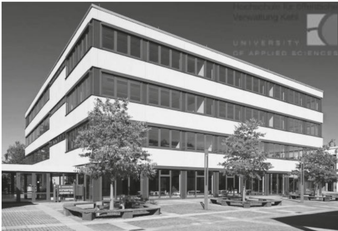
Studieninformationstag am 21. November 2018 Hochschule Kehl öffnet ihre Türen

Am 21. November öffnet die Hochschule für öffentliche Verwaltung Kehl ihre Türen für alle Interessierten und informiert über die Angebote zu den Bachelor- und den Masterstudiengängen.