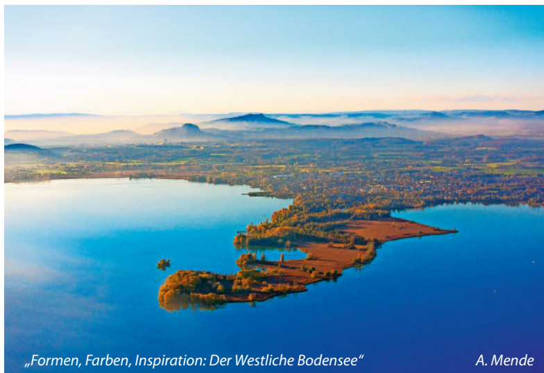
„Formen, Farben, Inspiration: Der Westliche Bodensee“

REGIO Konstanz-Bodensee-Hegau e.V. Obere Laube 71, 78462 Konstanz www.bodenseewest.eu