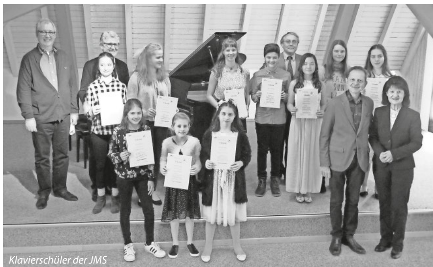
Klavierschüler der JMS